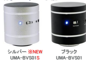
シルバー ※NEW UMA-BVS01S