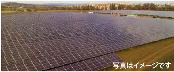
G シリーズ（野立て用）