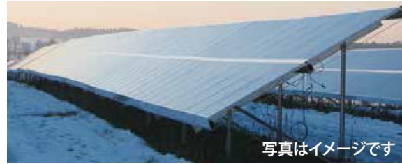
S シリーズ（積雪地域用）