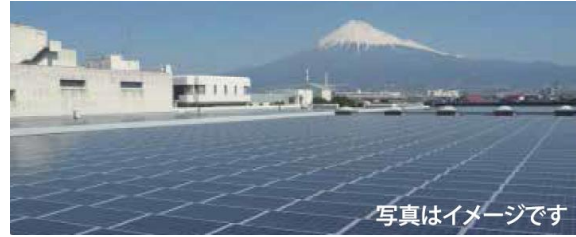
R シリーズ（折板屋根上用）